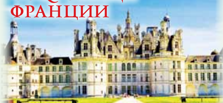
МОН-СЕН-МИШЕЛЬ, ЗАМКИ ЛУАРЫ: ШАМБОР, ШЕНОНСО